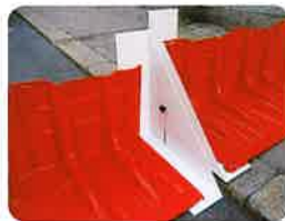
▲段差対応アタッチメント