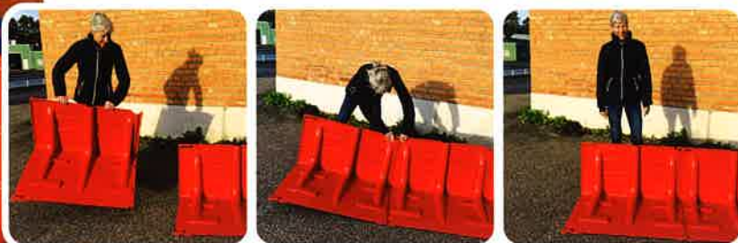
▲設置は、ボックスウォールを背後から見て左から右に並べる

Boxwallは特殊な工具やスキルを必要とせず設置ができ、ユニットのジョイント部(▼印)をつなぐことができます。各ジョイント部は±3度の調節ができ、カーブした設置場所でも対応可能です。