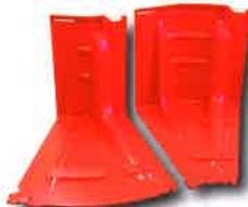
アウトコーナー(左)インコーナー(右)▶