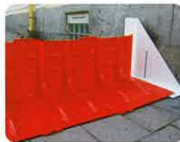
▲サイドアタッチメント