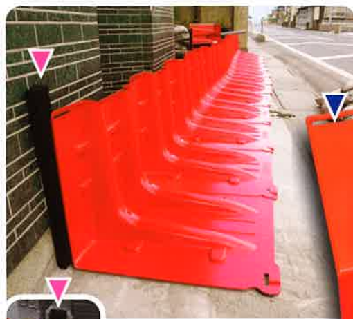
ボックスウォールの背後に壁がある場合はシーリング材を使用